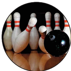
Im April: Kegeln im Neuhaus