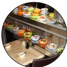
Im März: Running-Sushi